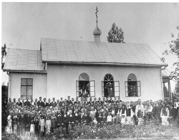
Село Озеряни. Освячення лютеранської церкви 12 липня 1937 р.